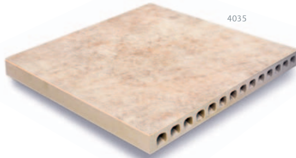
212_DÜNENBEIGE_KERACERAM SOLIDE TERRASSENELEMENT